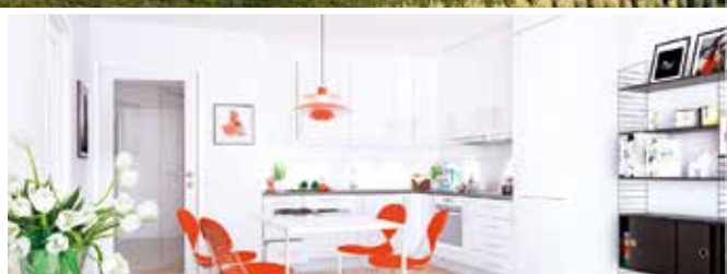
Kjøkken leil 204