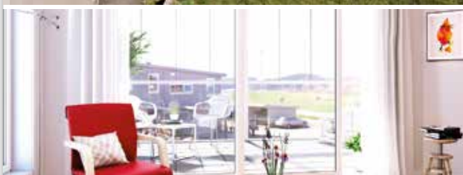
Utsikt og sol fra stue og balkong i leilighet 204